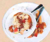
Restes de repas (pâtes, riz, légumes...)