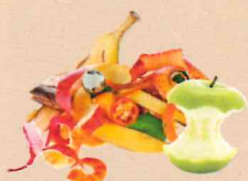
Pelures de fruits et épluchures de légumes