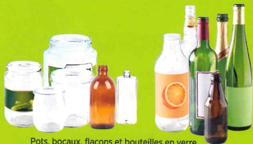
Pots, bocaux, flacons et bouteilles en verre

SANS BOUCHON NI COUVERCLE EN VRAC ET BIEN VIDÉS